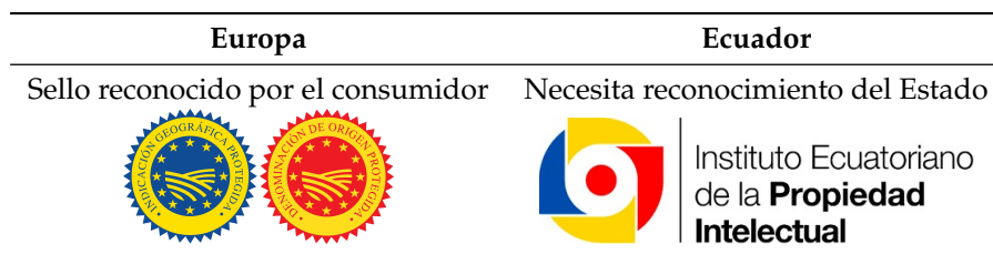
Tabla 2. Comparativo de Sellos de Reconocimiento de Productos Tradicionales entre Europa y Ecuador (Unión Europea, 2014; IEPI, 2016)

En Ecuador se pueden identificar varios sistemas de producción agropecuarios que se adaptan específicamente a su medio geográfico particular. A la vez se han identificado varios productos potenciales para una DOP de origen animal. Sobre todo, para poder obtenerlos, es necesaria una capacitación total del sistema en los procesos de producción